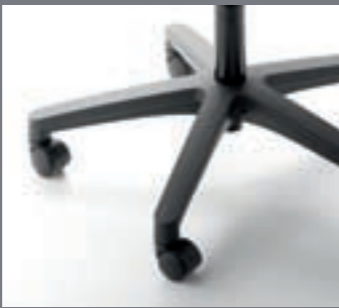
Base recta de poliamida / Piétement droit en polyamide / Polyamide straight base