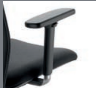
Brazos regulables 3D / Accoudoirs réglables 3D / Adjustable 3D-arms