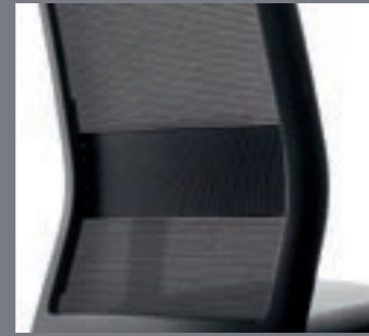
Regulación lumbar fácilmente desmontable / Régulation lombaire facilement démontable / Easily dismantled lumbar support