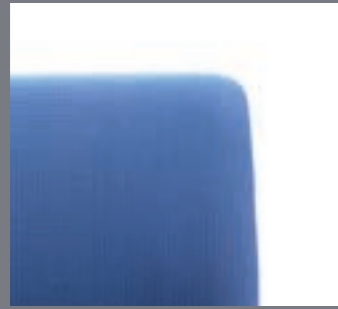
Respaldo tapizado con espuma sobreinyectada / Dossier tapissé avec mousse surinjectée / Upholstered backrest with injected foam