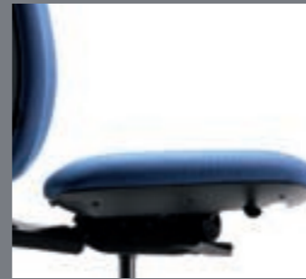
Mecanismo trasla / Translation d'assise / Sliding seat