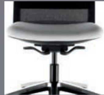
Mecanismo sincro Atom / Mécanisme synchro Atom / Synchro atom mechanism