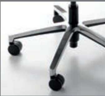
Base piramidal de aluminio pulido / Piétement pyramidal en aluminium poli / Polished aluminium angled base