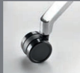
Ruedas de doble rodadura / Roulettes double galets standards / Double-wheel casters