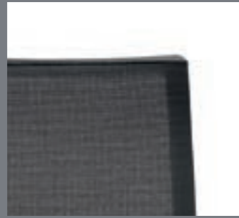
Respaldo de malla transpirable / Dossier en toile résille transpirable / Breathable mesh backrest