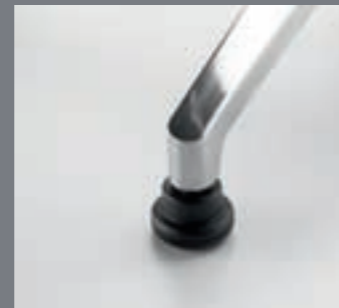
Niveladores / Patins / Glides