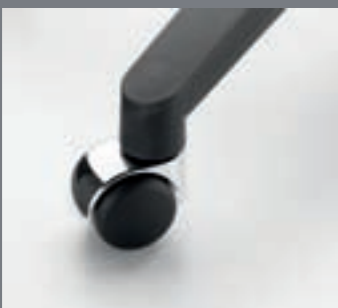
Ruedas cromadas / Roulettes chromées / Chromed casters