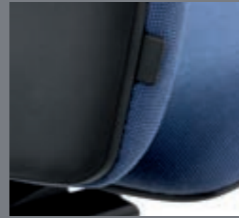
Regulación lumbar / Régulation lombaire / Lumbar support