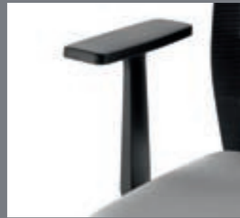
Brazos fijos negros / Accoudoirs fixes noirs / Black fixed arms